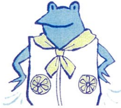
ファン付きウェア、 ネッククーラー