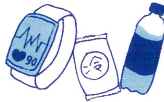
ウェアラブル端末、 応急セット